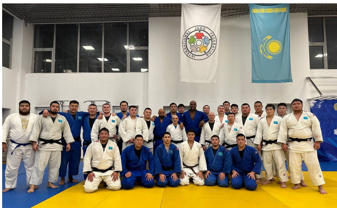
Рисунок 3 – Участники тренировочного лагеря (2023 г., г. Алматы)

В 2023 году на базе Академии дзюдо в г. Алматы был проведен тренировочный лагерь с участием самого титулованного дзюдоиста в истории Тедди Ринера (Франция), в котором приняли участие спортсмены национальных сборных и тренеры. Совместные тренировки позволили нашим спортсменам перенять не только технико-тактическое мастерство, но и профессиональное отношение к тренировочной и соревновательной деятельности. Все мероприятия, проведенные в рамках тренировочного лагеря, внесли существенный вклад в популяризацию дзюдо (рисунок 2).