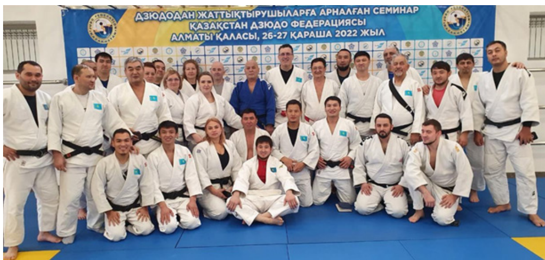
Рисунок 2 – Участники семинара тренеров по дзюдо